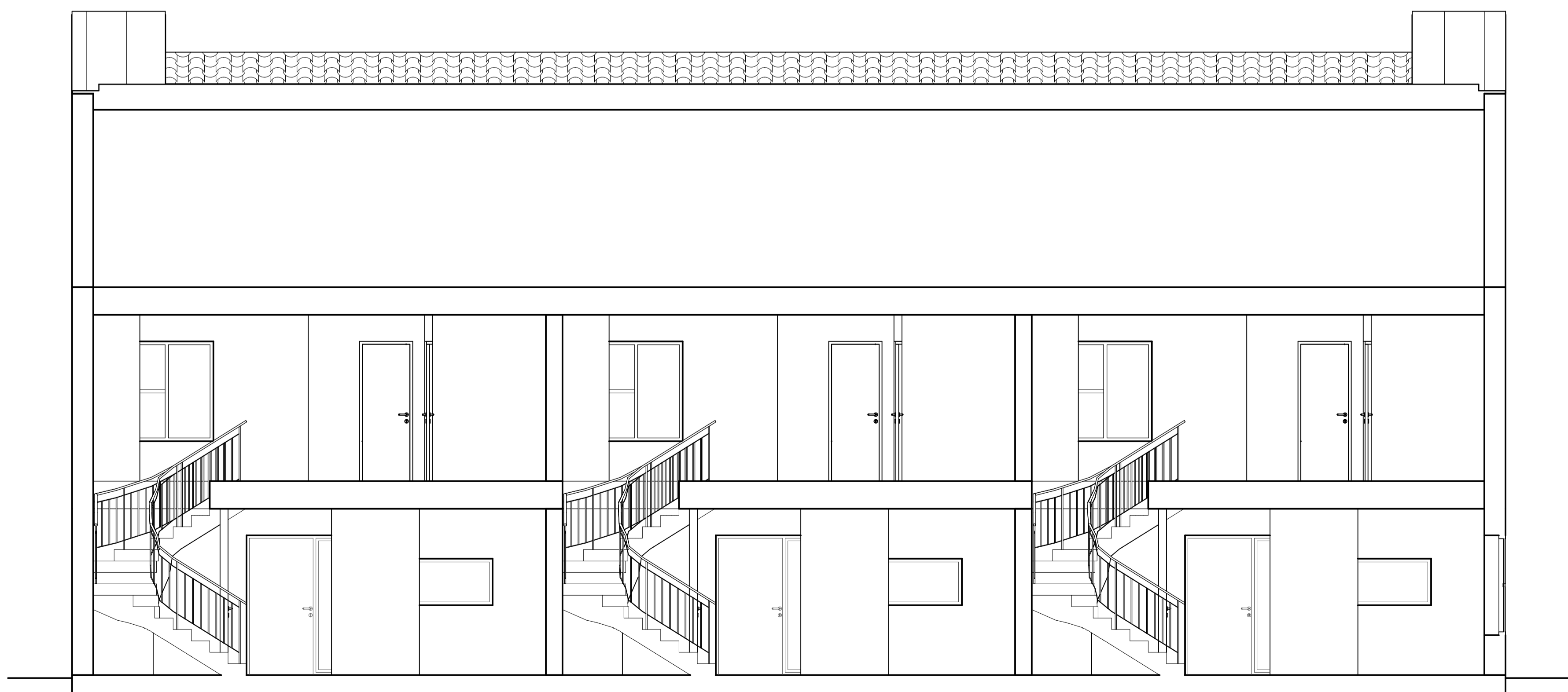
SEKTION A-A (Gavelhus 1) 1:50